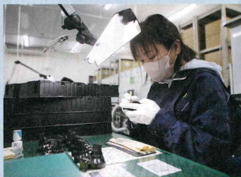
自動車などの樹脂コネクタのバリ処理や外観検査