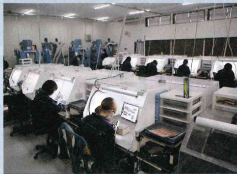
航空機エンジン部品やロケット部品の研磨など

エヌエス機器は4課1係で構成する。階段を上った先に事務所があり、別の階段を下ると各課に通じる建物が連なる。ウッドデッキでつながる課もあり、建物構造はユニーク。慣れないうちは迷子になるかも？