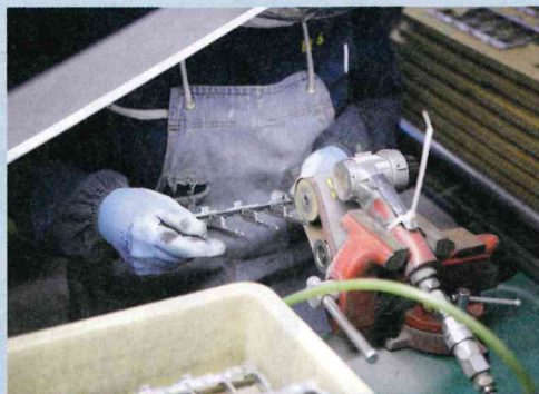
半導体装置をはじめとした金属・樹脂製品のバリ処理や研磨加工