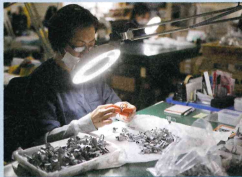
電子機器部品などの検査